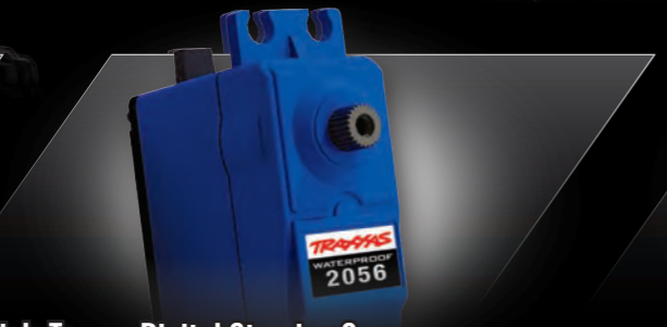
High-Torque Digital Steering Servo