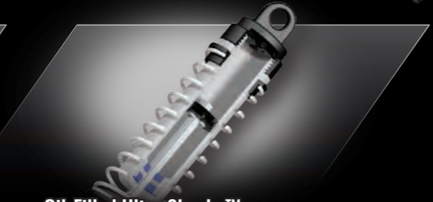
Oil-Filled Ultra Shocks™