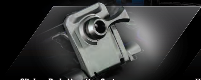
Clipless Body Mounting System