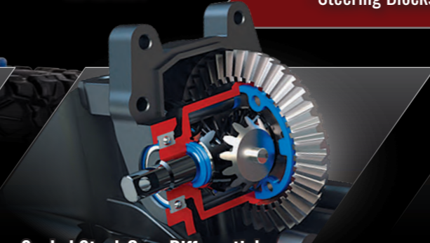
Sealed Steel-Gear Differentials