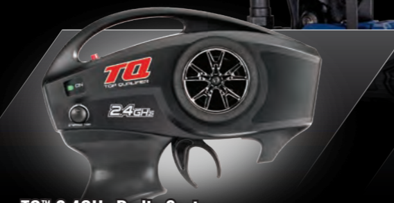
TQ™ 2.4GHz Radio System